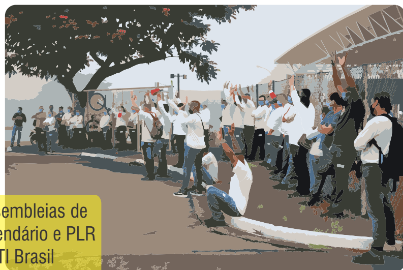
Assembleias de calendário e PLR na TI Brasil