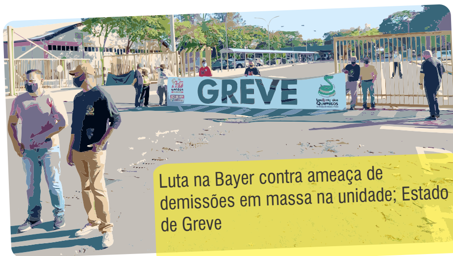
Luta na Bayer contra ameaça de demissões em massa na unidade; Estado de Greve