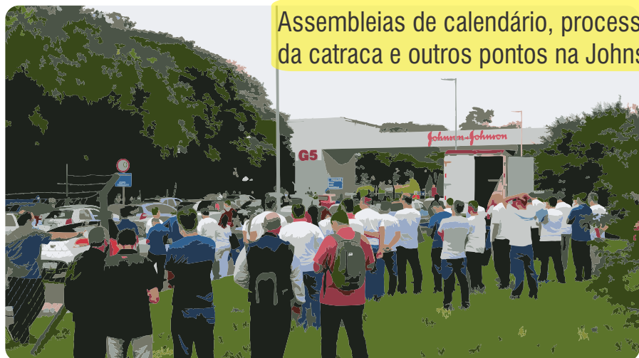
Assembleias de calendário, processo da catraca e outros pontos na Johnson