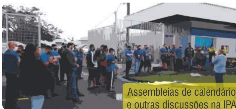
Assembleias de calendário e outras discussões na IPA