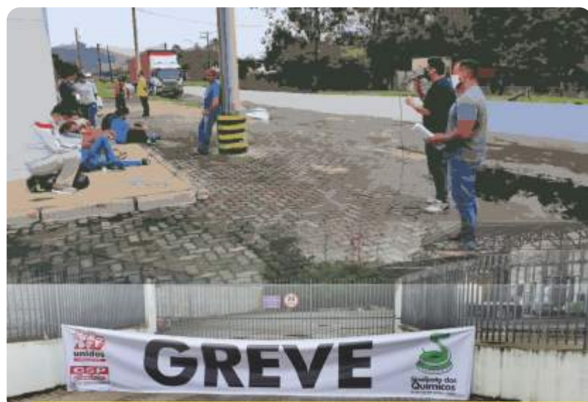
Parabéns aos trabalhadores (as) da Solutech, em Jacareí, que estiveram em greve por dois dias, em janeiro, por avanços no Acordo Coletivo e por respeito às medidas de combate ao covid-19. Segue a luta!